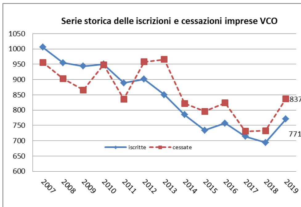
Elaborazione CCIAA VCO su dati Infocamere - Movimprese

Camera di Commercio Industria Artigianato e Agricoltura del Verbania Cusio Ossola S.S. del Sempione, n.4 - 28831 Baveno (VB) Tel. 0039 0323 912811 E-mail: segreteria@vb.camcom.it Sito: www.vb.camcom.it